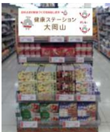
専用コーナー(イメージ)

内容:東急ストア大岡山店内に「健康ステーション大岡山」コーナーを設置し、身体に良い食品を販売します。第1回目として、減塩をテーマとした食品を展開します。