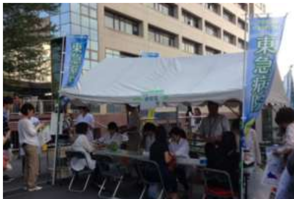
ブース出店(イメージ) ※写真は一昨年の様子