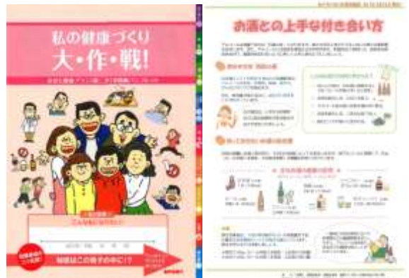
自治体発行健康情報ガイド(例)

内容:大岡山駅が位置する大田区や隣接する目黒区が発行している健康情報ガイド等を駅構内の専用パンフレットラックにて配布し、より多くの方々のお役に立つ健康情報を発信していきます。パンフレットはご自由にお持ち帰りいただけます。