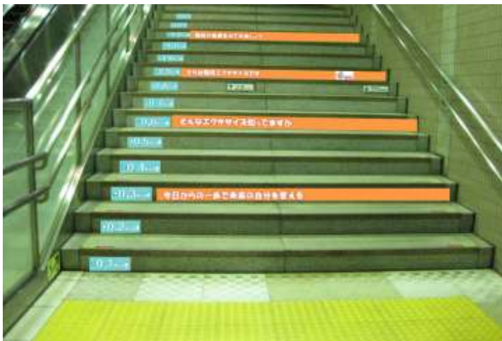
健康階段(イメージ)

内容: 駅構内に設置している自動販売機の商品ごとに、エネルギー(カロリー)を表示します。みなさまの健康管理にお役立てください。