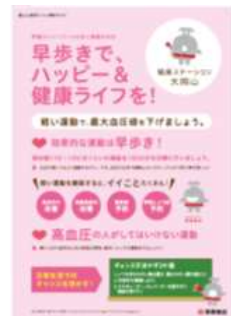
健康啓発ポスター(例)