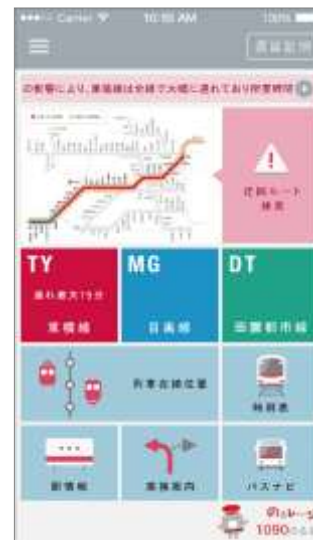
異常時「トップ画面」

「東急線アプリ」とは・・・運行情報、時刻表などの東急線に関わる情報、遅延証明書の機能からオリジナルポイント「のるる」が貯まるおトクなサービス「のるるレージサービス」などを無料でご利用いただけます。