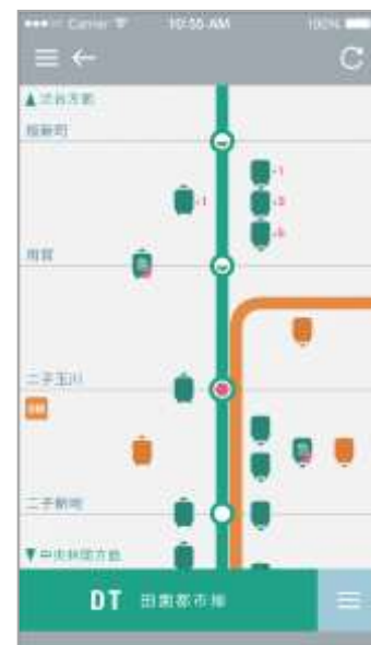
列車の現在位置表示