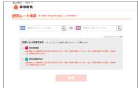
迂回ルート検索 (PCサイト)