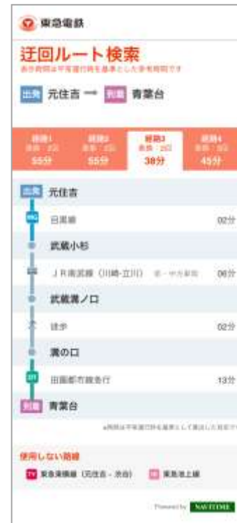
迂回ルート検索 (スマートフォンサイト)