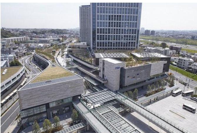
二子玉川ライズ外観

また、フードメニューは「Mallorca/マヨルカ」が手掛け、このビアテラスでしか味わえないオリジナルバルメニューもご用意。