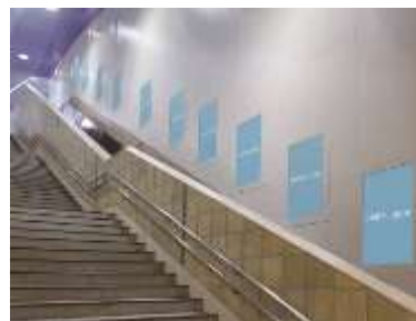
【二子玉川駅階段壁面サイネージ イメージ】

東急電鉄では今後も、沿線の主要な駅を中心に、表現力豊かな動画コンテンツでメッセージを発信できる訴求力の高い広告媒体の開発を推進します。パナソニックは、2020年に向けたインバウンド(外国人旅行客誘致)対応等の高まりをふまえ、デジタルサイネージを活用した広告・案内媒体の多言語化などの展開を強化します。