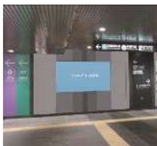
【渋谷駅ビッグサイネージ イメージ】