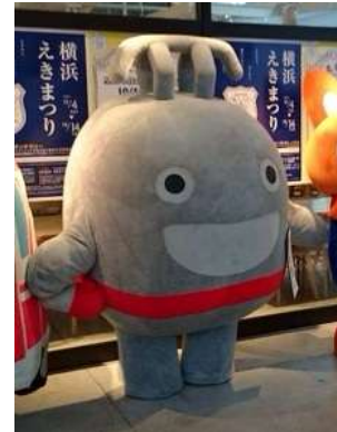
のるんが遊びに来るよ!

URL: http://www.tokyu.co.jp/tokyu/noruleage/index.html