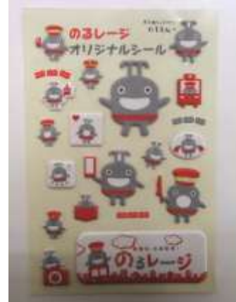
オリジナルぷっくりシールのイメージ

※キャンペーン期間中は東急線の一部の駅にブースを設置し、「のるレージ」に登録いただいている方を対象に「東急線キャラクターのるん オリジナルぷっくりシール」をプレゼントします。 配布場所・時間など詳細は以下Webサイトをご確認ください。