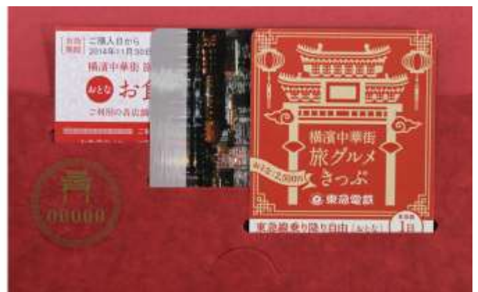
乗車券 封筒と券面イメージ

みなとみらい線の輸送人員が対前年で約9.6%増加するなど、横濱中華街は、2013年3月16日の東横線ー東京メトロ副都心線の相互直通運転開始以降、ますます活性化を強めている地域です。