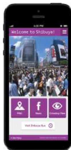
ログイン後トップ画面 イメージ