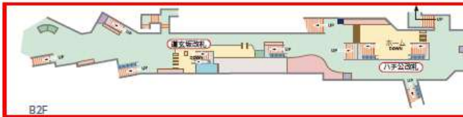
渋谷駅B2改札階 平面図