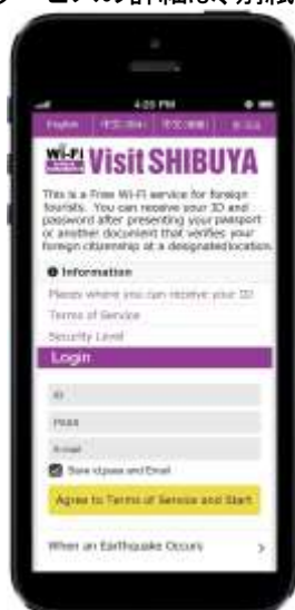
ログイン画面イメージ