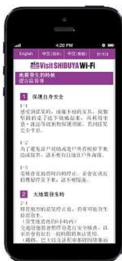
防災情報イメージ (中国語 繁体字)