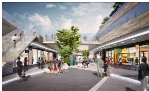
リボンストリート沿いの商業施設イメージ