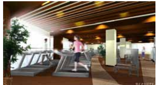
マシジムイメージ

特徴 エリア最大級のマシジムと25mの本格的プールを完備した総合型フィットネスクラブとしての出店を予定しています。スタジオプログラムやスイミングスクールなど、幅広い年齢層のお客様にご満足いただける多様なメニューをご用意します。