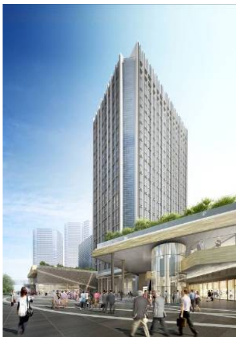
高層棟外観イメージ