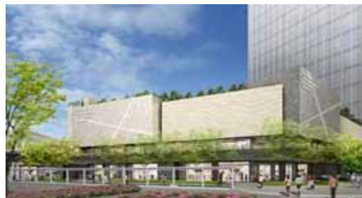
交広広場側外観イメージ