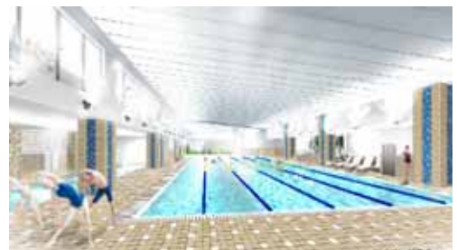
スイミングプールイメージ