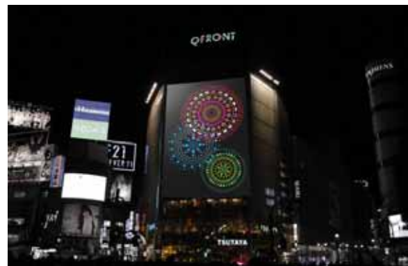
<渋谷デジタル花火大会 イメージ>