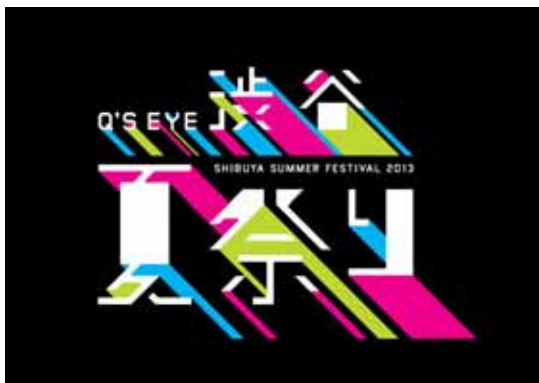
<Q S EYE渋谷夏祭り ロゴ>