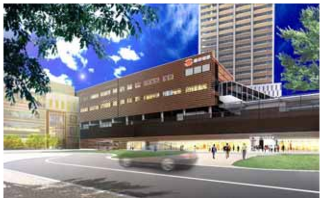
東急武蔵小杉駅ビル イメージ図