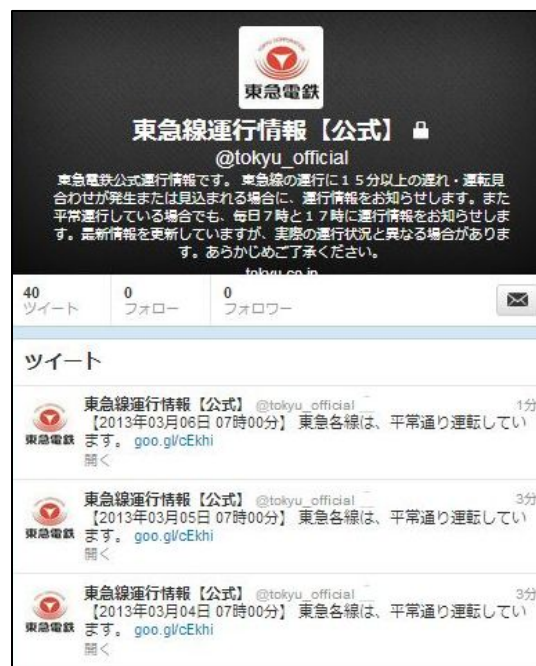
Twitterによる運行情報の配信画面(イメージ)

「Twitterによる運行情報配信サービス」ならびに「東急線運行情報メールの続報配信」の詳細は別紙のとおりです。