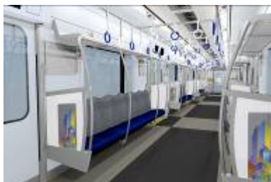
対象車両：1・3・8・10号車

また、背もたれを通常の車両より高くして座り心地にこだわったシートや、環境に配慮したLED車内照明の採用など、さまざまな機能を備えています。