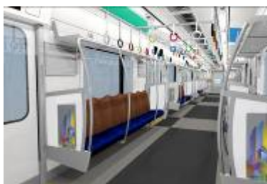
対象車両：2・4・6・9号車