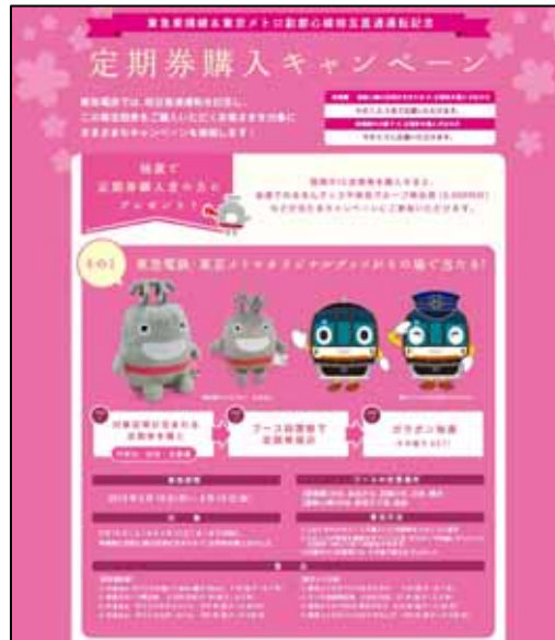
「その場で当たる！東横線・副都心線 定期購入キャンペーン」ポスター