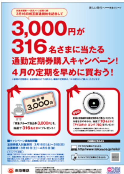
「通勤定期券購入キャンペーン」 ポスター