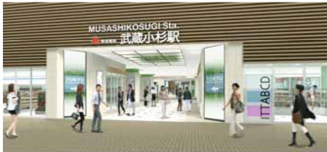
東急武蔵小杉駅東口出口のイメージ