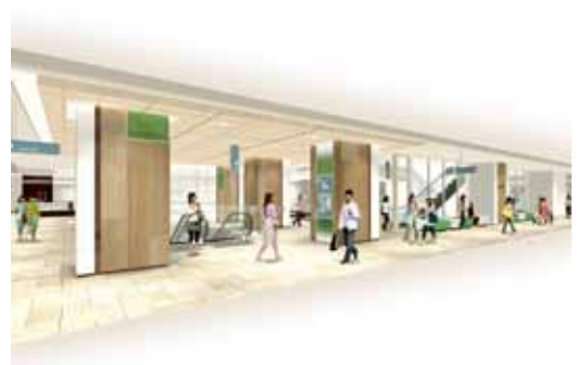
武蔵小杉東急スクエア内イメージ