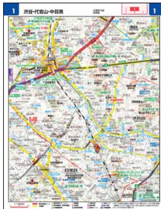
一時避難・帰宅支援マップ