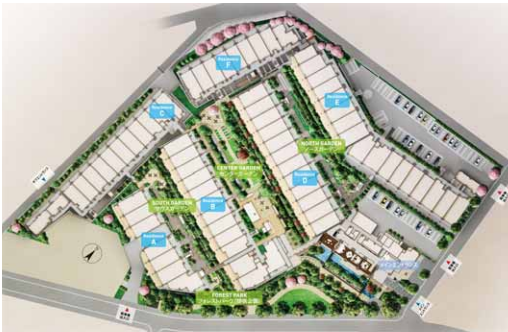
敷地配置図完成予想 CG

本物件は、建物や敷地内駐車場の一部が防災拠点になっており、お住まいの方に安心感を提供します。