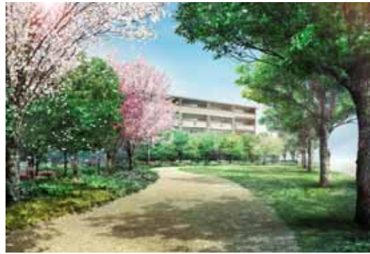
フォレストパーク（提供公園）完成予想 CG