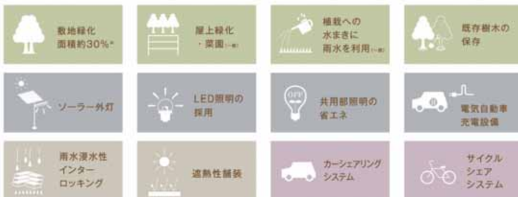
ドレッセ麓沼の杜エコプログラム

外構、共用施設そして各住戸における設備類に至るまで、杜の街ならではのエコロジー思想を隅々に行き届かせています。