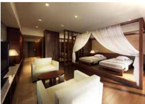
ゲストスイート完成予想 CG