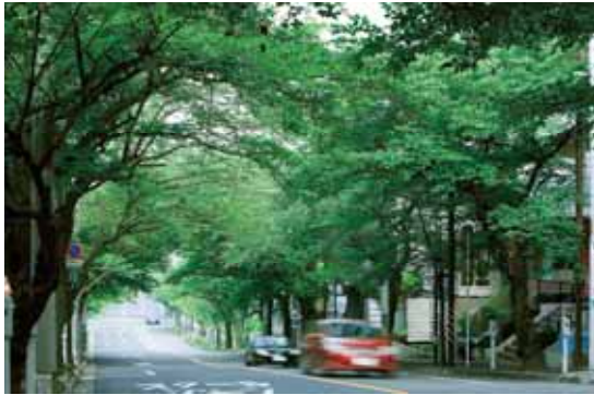
鷺沼小学校前 並木通り（約 810m）

田園都市線鷺沼駅は渋谷駅へ急行4駅17分。始発もあり利便性の高い鷺沼駅より徒歩9分です。上質な戸建街区が広がる第1種低層住居専用地域を望む高台の丘の上に誕生します。成熟した住宅地では希少性の高い大規模プロジェクトです。 邸宅街「鷺沼」に位置しながら、大型ショッピングゾーンが広がるたまプラーザ駅へも徒歩15分。“静穏”と“利便”が交わる好立地です。 鷺沼駅前に食料品スーパーの東急ストアなど48店舗が集うショッピングセンター「フレルさぎ沼」が今春オープンし、より一層便利になっています。