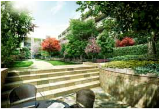
センターガーデン完成予想 CG