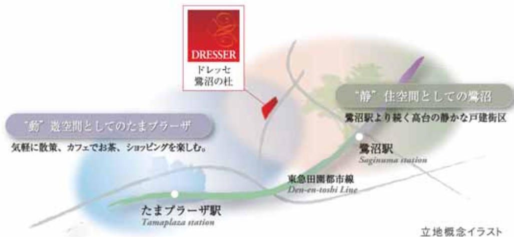
立地概念イラスト