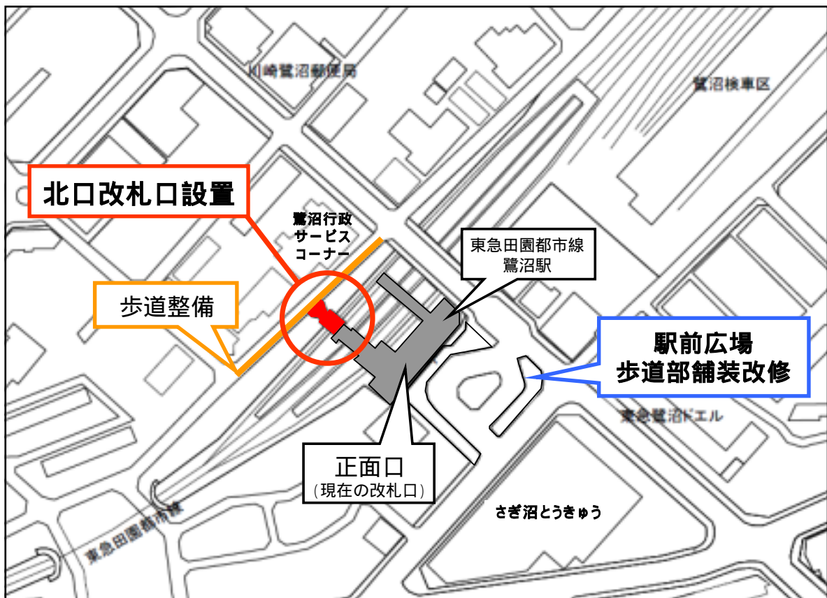
鷺沼駅周辺案内図

なお、新設改札口（北口改札）に接続する道路は、歩行者の安全性を確保するため、川崎市が歩道の整備を行っています。