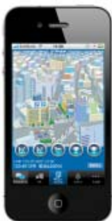
< ゲーム画面イメージ >