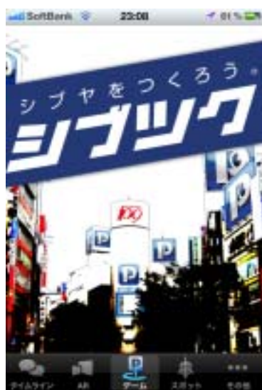
< ゲーム TOP イメージ >

利用者は、実際の店舗に設置されている AR マーカ『ピナクリマーカ』を読み込むことにより、ゲーム内の渋谷に、現実存在するお店を誘致することができます。ゲーム内の渋谷での売上をアップさせることで、ランキングの TOP を目指します。