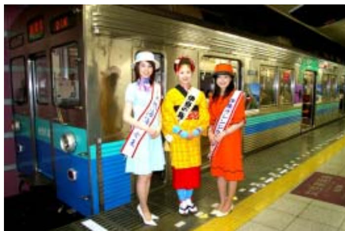
(左)ミスによる「伊豆のなつ号」内でのパンフレット配布と(右)伊豆急カラーに塗装した東急8500系(昨年の様子)