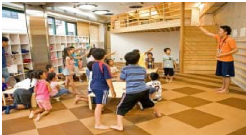
施設の様子（KBC桜新町）