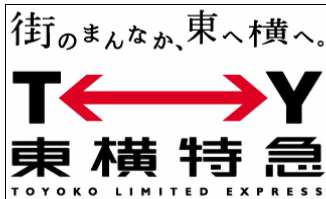
「東横特急」ロゴマーク