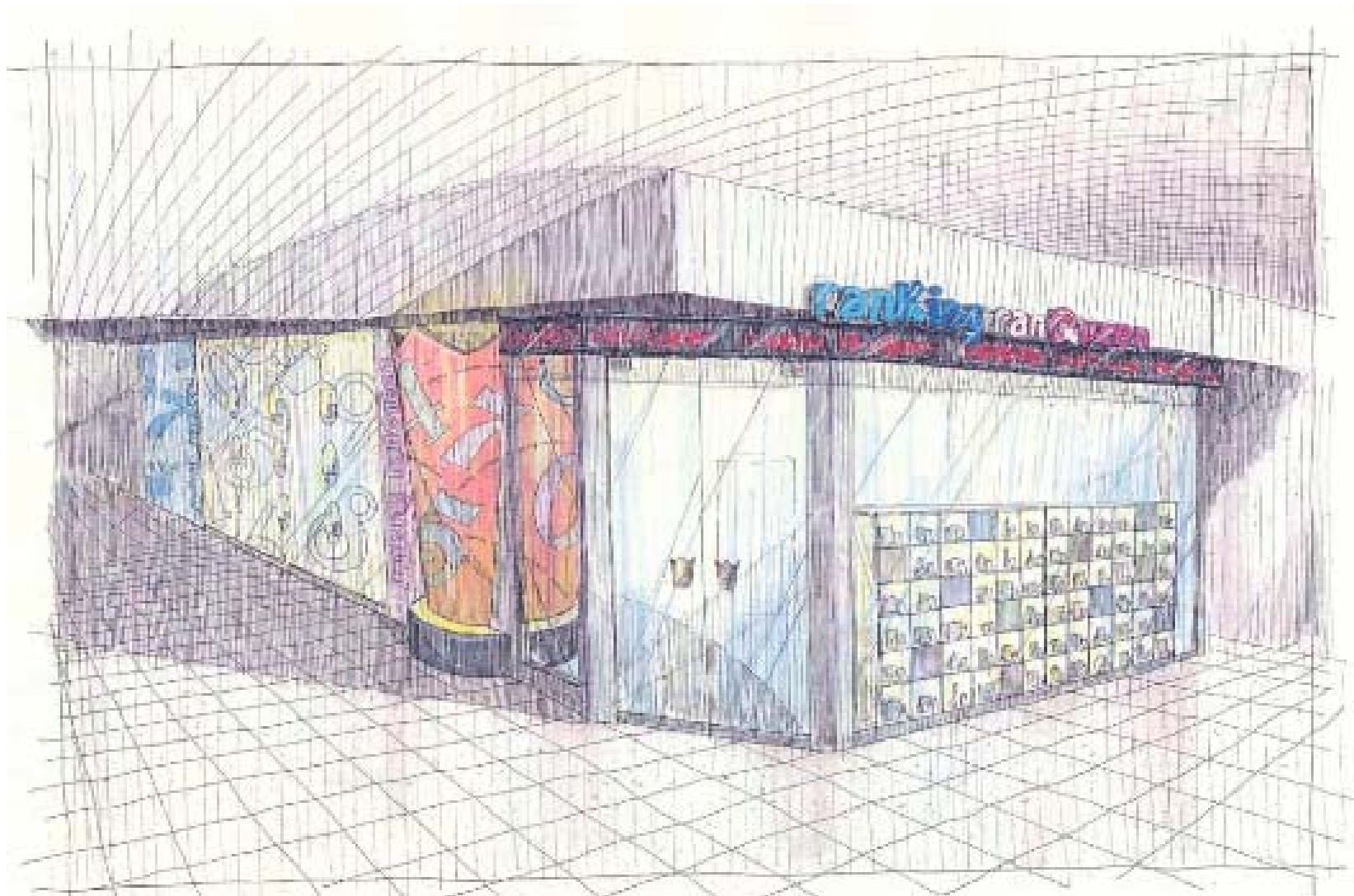
ランキンランキン新宿店 外観パース