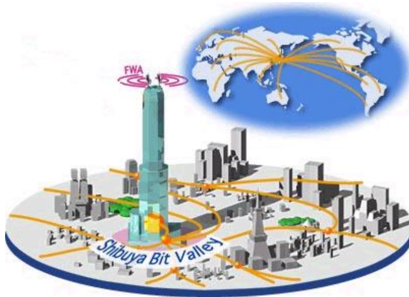
セルリアンタワーにおけるマルチキャリア環境のイメージ