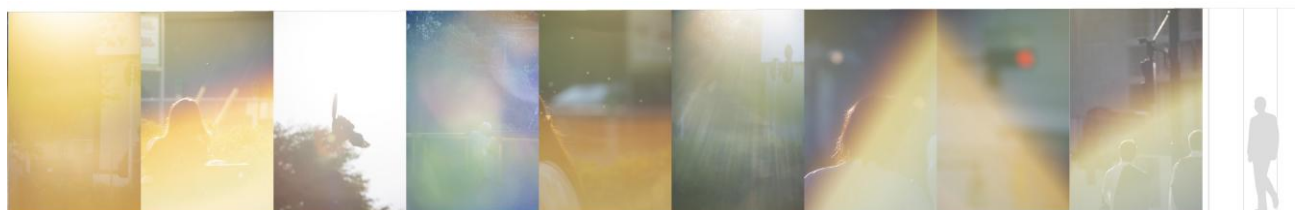
東面アート作品(一部)