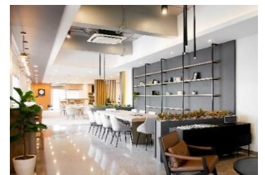
▲グリーンライフ シラチャ

構造:RC造 地上6階建 施設・サービス:24時間セキュリティ、日本語対応フロントデスク、 コワーキングスペース、ゴルフルームほか リニューアルオープン時期:2020年1月