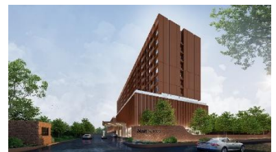
▲デュシットスイーツJパークシラチャ

総室数:193室 構造:鉄筋コンクリート造地上12階建て 施設・サービス:大浴場・スパ、プール、会議室、レストラン、ジムなど 開業時期:2028年(予定)