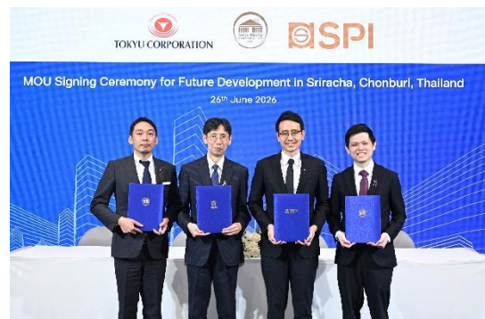
▲協定締結セレモニー (2026年6月26日バンコクで実施)