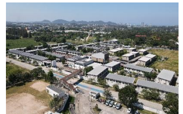
▲ハーモニック レジデンス シラチャ

構造:軽量鉄骨造 地上2階建(メゾネットタイプ) 施設・サービス:24時間セキュリティ、日本語対応フロントデスク、 カフェ、図書室、音楽室、体育館、テニスコートほか 開業時期:2016年4月