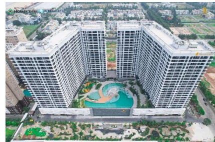
▲MIDORI PARK The GLORY

施設概要:分譲マンション 敷地面積:約19,000㎡ 総戸数:992戸 専有面積:約48~108㎡(1戸あたり) 階数:地上24階建 竣工時期:2024年10月 ※NTT都市開発株式会社との共同事業