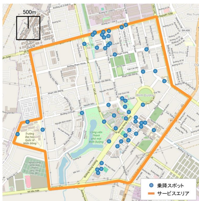
▲本サービス対象エリア(ビンズン新都市)