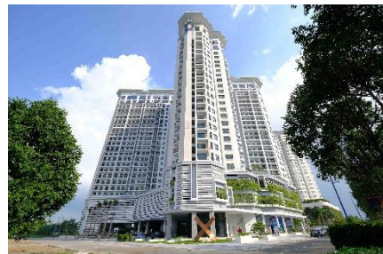
▲SORA gardens II

施設概要:分譲マンション 敷地面積:9,082㎡ 総戸数:406戸 専有面積:約67~105㎡(1戸あたり) 階数:地上24階建 竣工時期:2015年3月