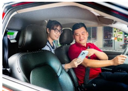
▲アプリ利用シーン

現在、ビンズン新都市では、ホーチミン市都市鉄道（メトロ）1号線の延伸計画が進められるなど、公共交通を軸としたまちづくりへの期待が高まっています。こうした中、ベカメックス東急は、路線バスとデマンドモビリティを組み合わせ、ビンズン新都市内に重層的な公共交通ネットワークを構築するとともに、将来の鉄道アクセスを見据えたラストワンマイル交通の整備を進めていきます。今後も、住宅・商業施設の不動産開発を進めるとともに、公共交通と一体となった持続可能なまちづくり（TOD: Transit Oriented Development）を推進し、ビンズン新都市の発展に貢献していきます。