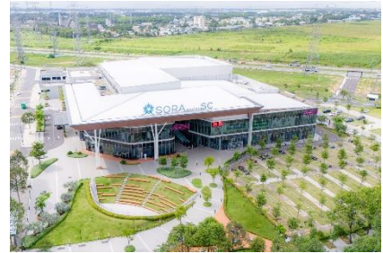
▲SORA gardens SC