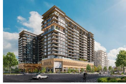
▲MIDORI PARK The TEN