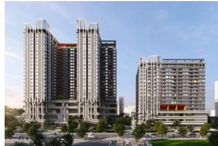
▲MIDORI PARK The NEST