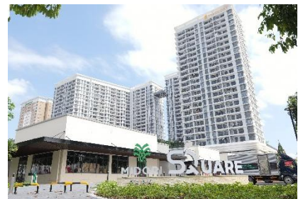
▲MIDORI PARK SQUARE