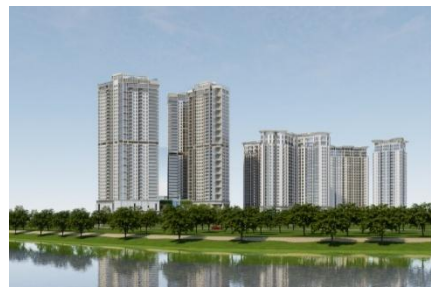
▲SORA gardens III

施設概要:分譲マンション 敷地面積:7,948㎡ 総戸数:557戸 専有面積:約55~101㎡(1戸あたり) 階数:地上24階建 竣工時期:2021年5月 ※三菱地所レジデンス株式会社との共同事業