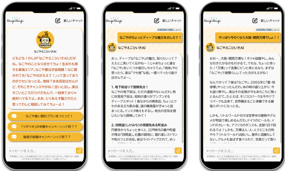
▲なごやえこひいきAIの操作画面イメージ