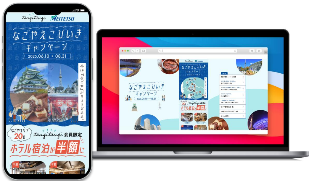
▲特設サイトの画面イメージ

本連携・本キャンペーンの特設サイトでは、“なごや圏”を旅の目的地に選びたいくなるきっかけとして、会話型AIコンシェルジュ「なごやえこひいきAI」を提供します。たとえば「大阪・関西万博に行く予定」と入力すると、「その前に愛知で予習しませんか？2005年に愛・地球博やりましたから」と返してくるなど、どんな内容にも“なごや”を全力でおすすめしてくる偏愛仕様のAIです。あまりの推しぶりにツッコミを入れたくなる一方で、“なごや圏”の意外な魅力を知り、雑談のきっかけとしても楽しめます。