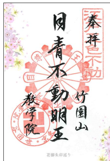
▲花御朱印イメージ