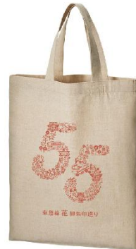
▲55寺社満願達成記念品 トートバック・キーホルダー イメージ