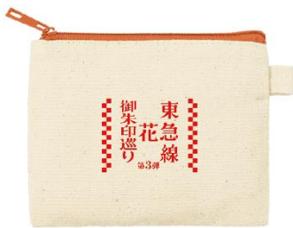
▲28寺社達成記念品 ミニポーチ イメージ