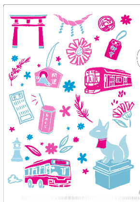
▲御朱印フォルダー