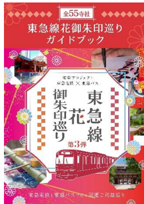
▲対象の寺社の情報をまとめたガイドブック

(3)内 容 ・ガイドブック ・マップ(東急線路線図、対象寺社の最寄り駅とバス停) ・御朱印フォルダー ・参加者カード