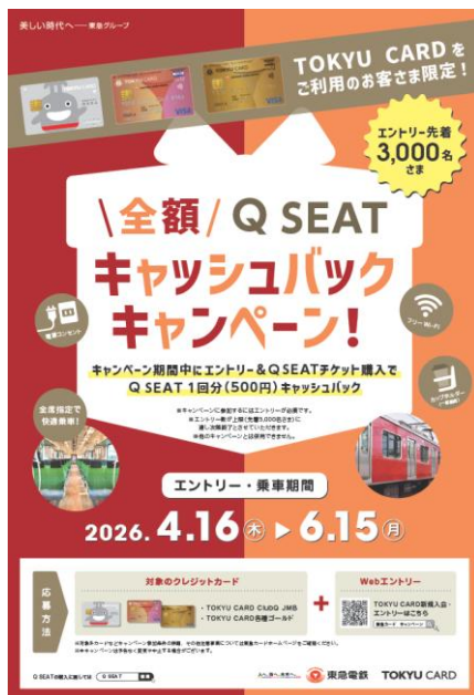
▲キャンペーンポスター