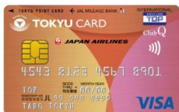
▲ TOKYU CARD ClubQ JMB