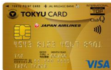
▲ TOKYU CARD ClubQ JMBゴールドカード

※ 1 PASMOオートチャージサービスは株式会社パスモが提供するサービスです。