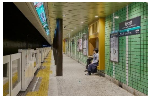
▲リニューアル後の駒沢大学駅(ホーム)

本工事は、コンセプトに「UNDER THE PARK」を掲げ、地域の憩いの場である都立駒沢オリンピック公園の最寄り駅として、公園とともにあるライフスタイルをイメージするデザインを取り入れ、地域に開かれた新たな駅のあり方の実現を目指しています。