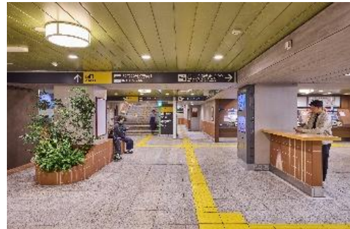
▲リニューアル後の駒沢大学駅(コンコース)

東急と東急電鉄は、今後も駅の魅力を高めるリニューアルや沿線開発、地域との連携などを通して、東急線沿線のサステナブルなまちづくりを推進していきます。