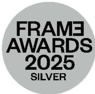
▲フレームアワード「Silver」バッジ

(駒沢大学駅リニューアル受賞ページ https://frameweb.com/project/115357 )