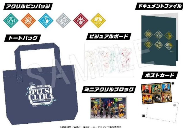
▲ご宿泊特典グッズ