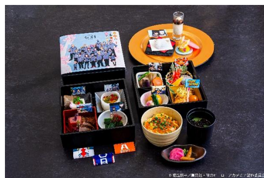
▲日本料理「旬彩」 “雄英高校”メモリアル旬彩弁当

※コラボメニューについては12月22日(月)12:00から予約受付開始となります。