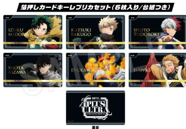
▲ご宿泊者限定購入可能 お土産グッズ