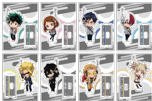
▲つながるトレーディングミニアクリルスタンド(type A)