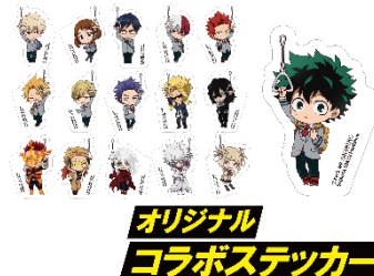
▲オリジナルコラボステッカー