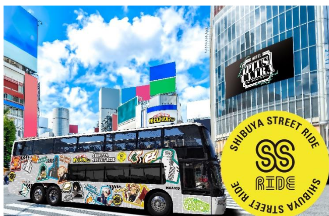
▲コラボバスイメージ

■乗車特典: アクリル記念乗車券／ミニクリアファイル／バスデザインアクリルチャーム／オリジナル記念ポストカード