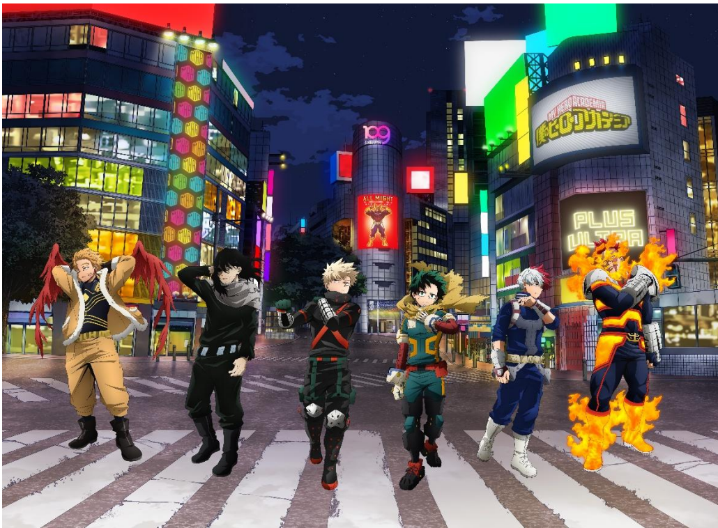
▲僕のヒーローアカデミア×東急(株)グループコラボレーション 描き下ろしビジュアル

本作と、渋谷をはじめとする東急線沿線を中心にまちづくりを行う当社との特別なコラボレーションに、ぜひご期待ください。