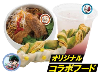
▲オリジナルコラボフード