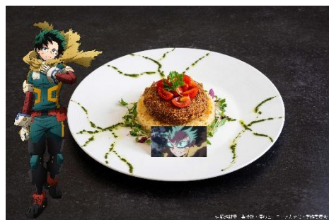
▲ラウンジ「エスタシオン カフェ」 緑谷出久の洋風カツレツプレート