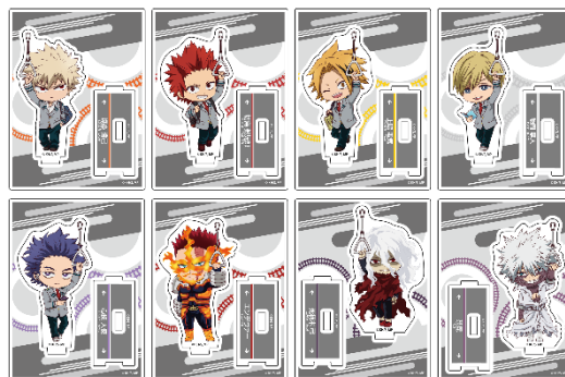
▲つながるトレーディングミニアクリルスタンド(type B)

また、2026年2月9日(月)～2026年4月30日(木)には渋谷エクセルホテル内のラウンジ「エスタシオン カフェ」での一部商品の販売、2026年2月3日(火)～2026年4月6日(月)には駅構内売店toksの一部店舗での一部商品の販売、2026年1月16日(金)～2026年4月30日(木)にはオンライン販売も予定しています。