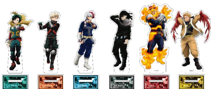
▲アクリルフィギュアスタンド(SHIBUYA HEROES MISSION ver)