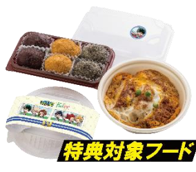
▲オリジナルかけ紙・オリジナルシール