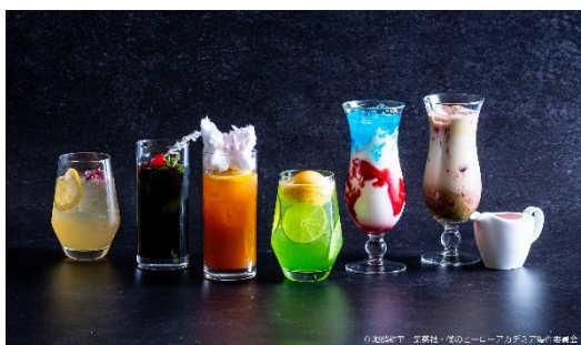
▲ラウンジ「エスタシオン カフェ」 ドリンク6種類