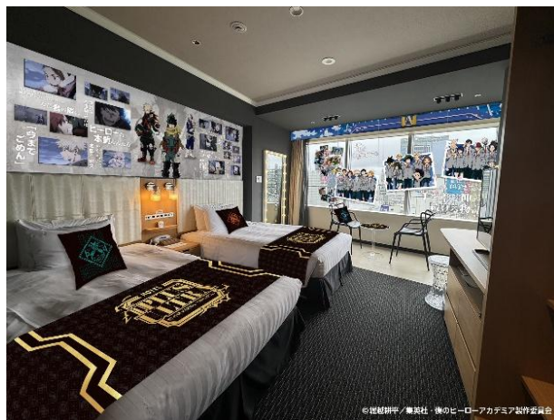
▲コンセプトルーム「雄英高校1年A組」ルーム