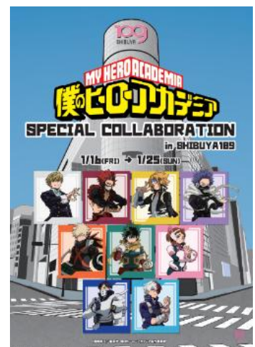
▲SHIBUYA109渋谷店 全館コラボキャンペーンビジュアル