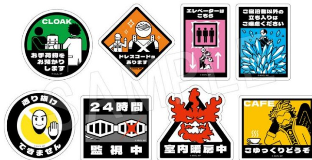
▲ホテル案内ステッカーセット