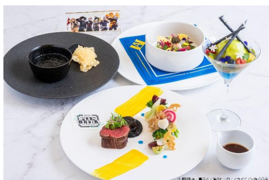
▲レストラン「ア ビエント」 「À bientôt course -Plus Ultra! !-」