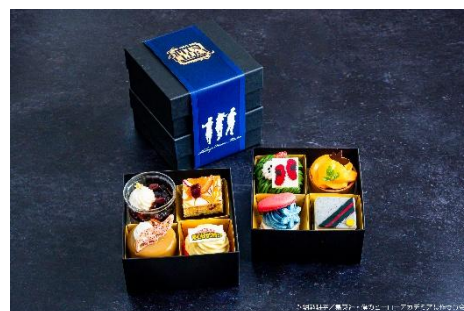
▲ラウンジ「エスタシオン カフェ」 『僕のヒーローアカデミア』SWEETS BOX