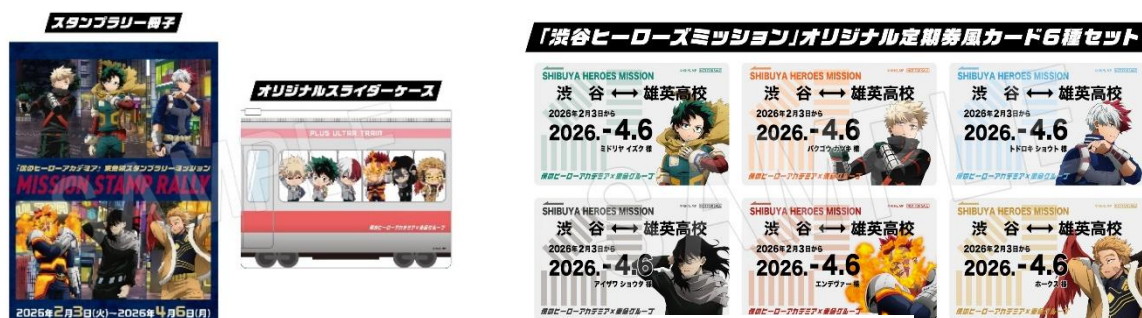
▲達成特典「定期券風カード」