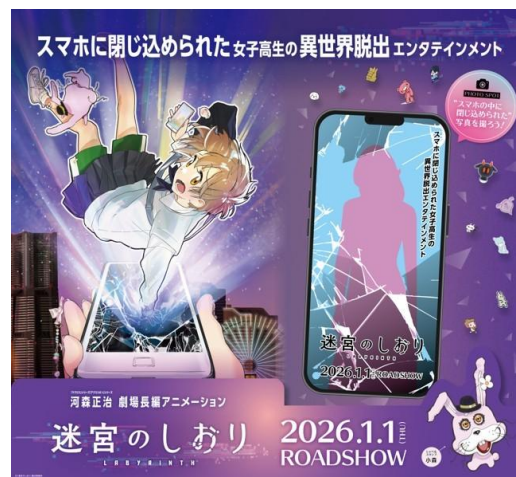
▲『迷宮のしおり』フォトスポットイメージ