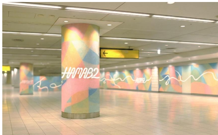
▲オープンスペース「HAMA B2」イメージ