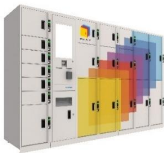
マルチエキューブ外観 (イメージ)

株式会社JR東日本スマートロジスティクスが運営する多機能ロッカー「マルチエキューブ」は、通常の預入利用に加え、「マルチエキューブWEBサイト」から空き検索・事前予約も可能です。