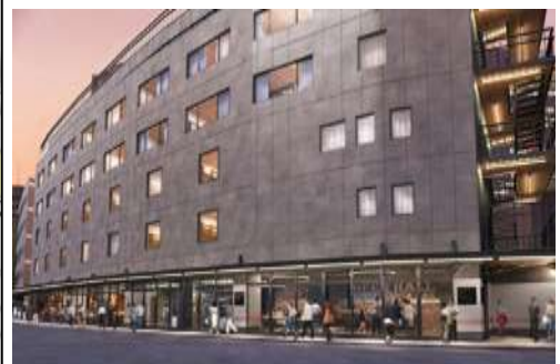
▲B棟(ホテル・事務所・店舗)イメージ