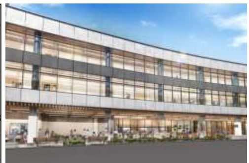
▲A棟(保育所)イメージ