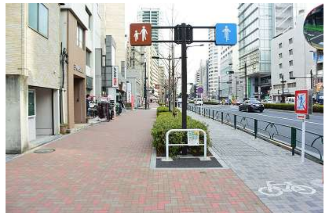
▲歩車・自転車が分離されており、通勤時には多く利用されています。