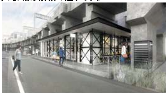
【高架下外観イメージ】