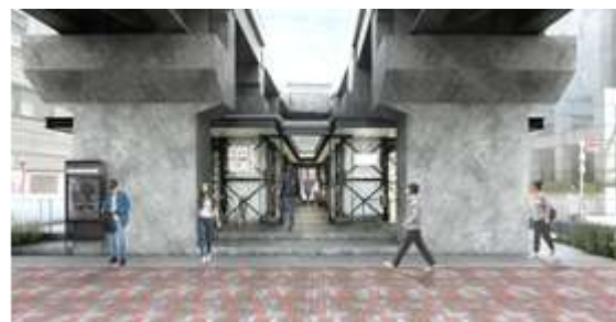
【山手通り沿い施設(STYLE-B)イメージ】以上