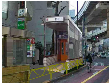
三軒茶屋駅エレベーター設置イメージ