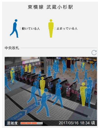
駅視—vision (エキシビジョン)