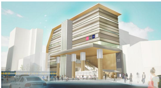
▲池上駅駅ビル外観イメージ

池上線戸越銀座駅リニューアル(「木になるリニューアル」)に引き続き、旗の台駅でも多摩産材を活用して、築66年の老朽化したホーム屋根や待合室のリニューアルを行っています。今後、駅舎の改修も予定しています。