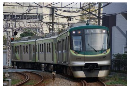
池上線・東急多摩川線「7000系」6編成