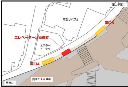
三軒茶屋駅付近 (平面図)

田園都市線では、つくし野駅東口と改札階を結ぶエレベーターの運用を2018年4月に開始しました。また、三軒茶屋駅、桜新町駅でエレベーターを増設するとともに、宮前平駅、江田駅でエスカレーター整備も行います。これによりストレスフリーな移動が実現します。