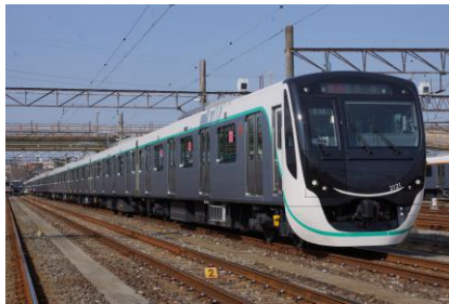
田園都市線「2020系」6編成

田園都市線では、2018年3月に新型車両「2020系」の導入を開始しましたが、2022年までの旧型車両の置き換えに向けて6編成を新たに導入します。また池上線・東急多摩川線では、今年度に7000系6編成を導入し、旧型車両7700系全編成の置き換えを完了します。田園都市線の新型車両「2020系」と大井町線の新型車両「6020系」には高機能の車両情報管理装置を搭載しており、車両と地上にてデータを送受信できるネットワークの整備を進め、今後、車両の状態監視や故障の予兆検知などへの活用を目指します。