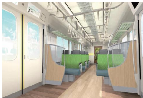
右: 有料着席サービス運用時)