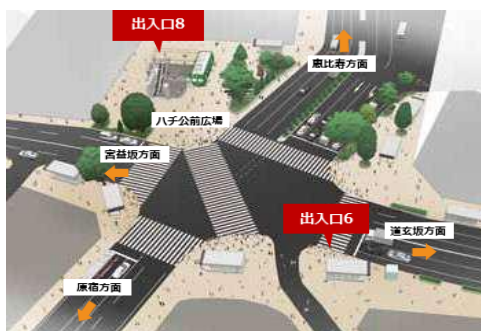
渋谷駅スクランブル交差点付近

渋谷駅では、昨年度「ヒカリエ2改札」から東横線・副都心線ホームを結ぶエレベーターや、「ハチ公改札」付近から「渋谷地下街」を結ぶ上下エスカレーターを運用開始することにより、利便性を向上してきました。今年度は、出入口6番付近のエレベーターを運用開始し、地下2階(改札階)から地上スクランブル交差点付近を結ぶことで、地上や地下1階「渋谷ちかみちラウンジ」へのアクセスがさらに便利になります。