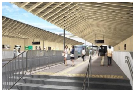
▲旗の台駅駅改修後イメージ