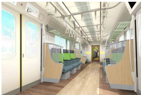
大井町線有料着席サービス車両 (左: 通常時)

大井町線では、今年度冬、平日の夜間帰宅時間帯に有料座席指定サービスを開始します。運転区間は、大井町線大井町駅から田園都市線長津田駅(種別: 急行)で、19時30分から23時台の間5本程度の運行を予定しています。