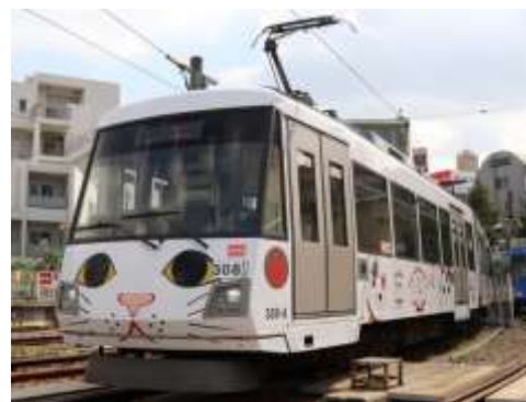
▲五電110周年記念イベント運行時の招き猫電車