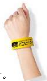
▲リストバンド型1日乗車券イメージ

きっぷ有効日に対象店舗でのリストバンドの提示により、割引などの特典が受けられます。