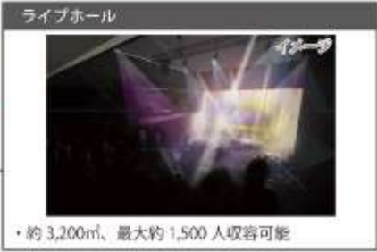
▲複合エンターテインメント施設イメージ