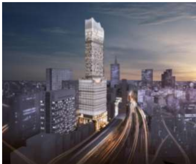
▲大久保方面（北西側）からの眺望イメージ