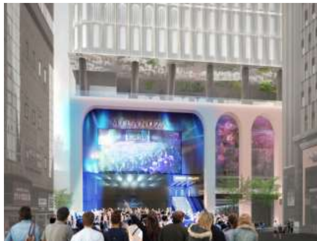
▲広場連動イベントイメージ（まちなか音楽フェス）