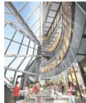
▲3階アーバン・コアイメージ(西側より)

渋谷スクランブルスクエア株式会社、東京急行電鉄株式会社、東日本旅客鉄道株式会社、東京地下鉄株式会社は、「渋谷スクランブルスクエア第Ⅰ期(東棟)」(以下、本施設)の開業時期を2019年「秋」とするとともに、展望施設・産業交流施設の名称・ロゴとコンセプトなどを発表します。