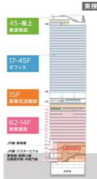
▲施設構成イメージ