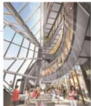
▲3階アーバン・コアイメージ(西側より)