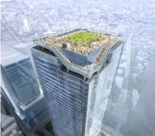
▲SHIBUYA SKY 俯瞰イメージ

日本最大級の屋上展望空間(約2,500㎡)を有し、渋谷最高峰の地上約230メートルを誇る展望施設が渋谷の中心に誕生。スクランブル交差点や、富士山、東京スカイツリー®など、360°一望できるパノラマビューを実現し、空と一体となる圧倒的解放感・浮遊感を提供します。また、デジタルテクノロジーを演出に用い、来場者の感覚を刺激する体験型空間など、雨天でも楽しめる屋内展望施設(約3,000㎡)も兼ね備えます。SHIBUYA SKYは、世界中の人々が集まるスクランブル交差点を眼下におさめ、渋谷のダイナミズムを体感できる新たな街のシンボルになることを目指します。