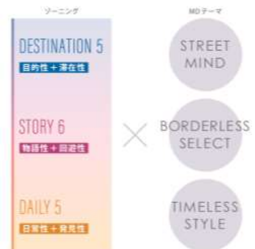
▲商業施設MDディレクション

時代を超えて愛されるモノや価値を取り入れ、自由に組み合わせしていくスタイルを発信