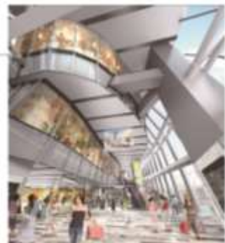
▲2階アーバン・コアイメージ(渋谷セカリエ連絡通路出入口ロより)