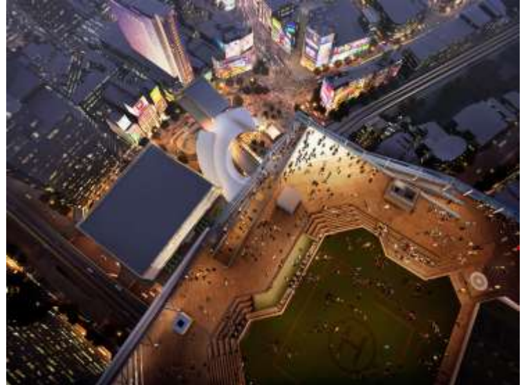
▲SHIBUYA SKY スクランブル交差点を見下ろすイメージ