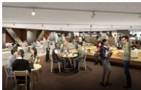
▲SHIBUYA QWS タウンホールイメージ