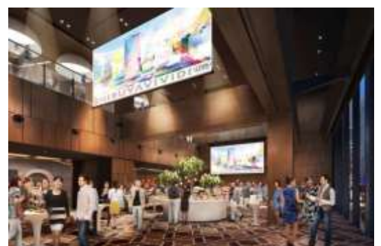
▲商業施設イベントスペースイメージ

ビジョンである「世界最旬」を体現する場として、週から月単位でテナントを入れ替えるポップアップスペースや、本格的な厨房を備えるなど、多様なニーズに対応可能なイベントスペースを複数区画展開。新しい、まさに最旬なモノ・コト・トキを、このスペースから提供します。