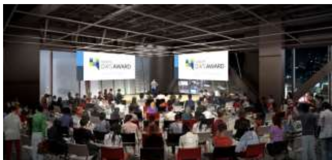
▲SHIBUYA QWS イベントスペースイメージ