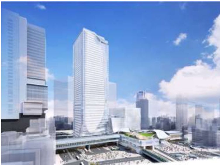
▲外観イメージ(宮益坂交差点方面より望む)

名称: 渋谷スクランブルスクエア／SHIBUYA SCRAMBLE SQUARE 第Ⅰ期(東棟) 事業主体: 東京急行電鉄株式会社、東日本旅客鉄道株式会社、東京地下鉄株式会社 所在: 東京都渋谷区渋谷二丁目23番 外 用途: 事務所、店舗、展望施設、駐車場など 延床面積: 約181,000㎡ (参考 全体完成時 約276,000㎡) 階数: 地上47階 地下7階 高さ: 約230m 設計者: 渋谷駅周辺整備計画共同企業体 (株)日建設計、(株)東急設計コンサルタント、(株)ジェイアール東日本建築設計事務所、メトロ開発(株) デザイナー: (株)日建設計、(株)隈研吾建築都市設計事務所、(有)SANAA事務所 施工者: 渋谷駅街区東棟新築工事共同企業体(東急建設(株)、大成建設(株)) 運営会社: 渋谷スクランブルスクエア株式会社 * 東京急行電鉄株式会社、東日本旅客鉄道株式会社、東京地下鉄株式会社の3社共同出資 開業: 2019年秋