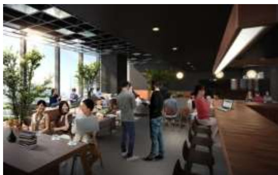
▲SHIBUYA QWS サロンイメージ