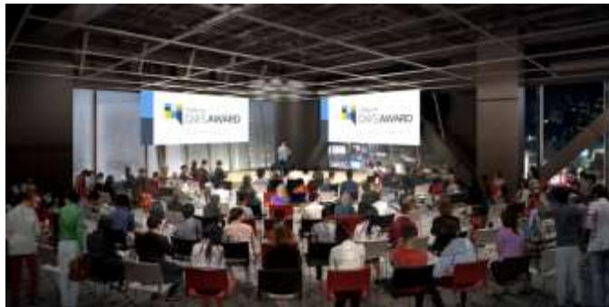
▲SHIBUYA QWSイベントスペースイメージ