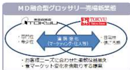
▲新業態イメージ図