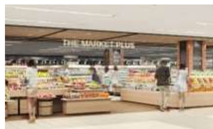
▲融合売場イメージパース