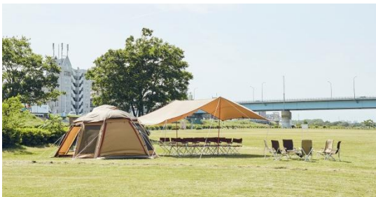
▲CAMPING OFFICE TAMAGAWA (イメージ)