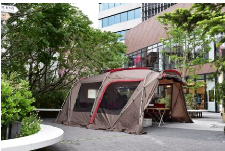
▲本サービス利用イメージ①