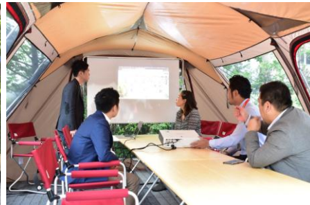
▲本サービス利用イメージ②