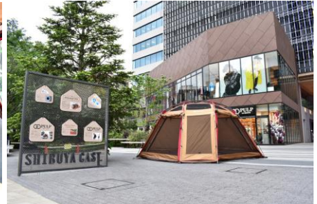
▲本サービス利用イメージ③ 以上