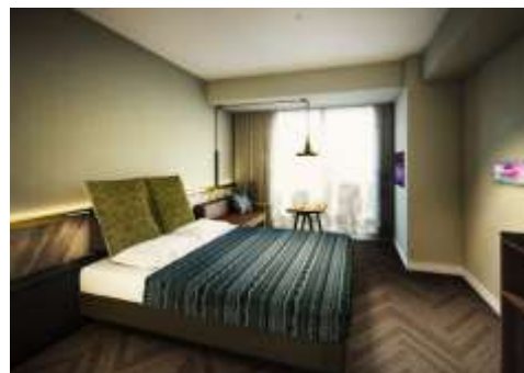
▲ゲストルームイメージ