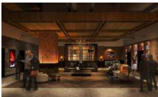
▲4階ロビーラウンジイメージ

東急電鉄と東急ホテルズは、本ホテルを通じて、増え続ける観光客やビジネス客の滞在を支えるとともに、宿泊ゲストをはじめ、本施設内に整備されるオフィスやホール利用者の交流空間としての役割を果たすことで、東急グループが目指す「エンタテインメントシティ SHIBUYA」を軸とした、新しい渋谷カルチャーを発信していきます。