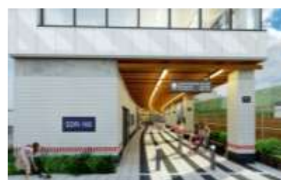
▲A棟自由通路イメージ