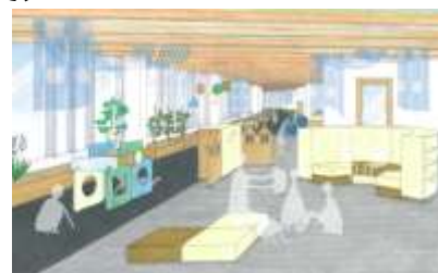
▲A棟こども園 内装イメージ

園児は保護者の働いている状況に関わりなく多様な保育を受けることができ、周辺地域の子育て環境の充実を図るとともに、子育て世代の多様な保育のニーズに応えるため、短時間保育などの取り組みも実施します。またカフェや子育て支援スペース、情報発信スペースなどが一体となった空間を創出し、地域の子育て世代の支援を行うとともに、さまざまな人々が子育てを身近に感じることでできる場所を設けることで、街に開かれたこども園として、新たな地域の魅力と賑わいを創出します。