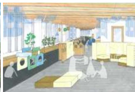
▲A棟こども園 内装イメージ