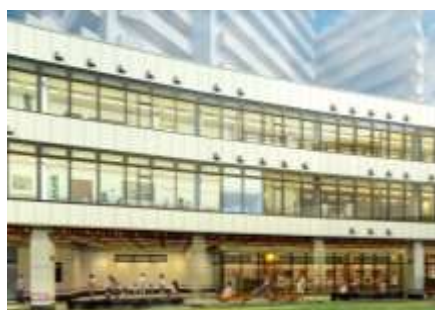
▲こども園が開園するA棟外観イメージ

今後も、渋谷ストリームや官民連携による渋谷川の整備とともに本計画を推進し、渋谷～代官山の渋谷駅南側エリアを楽しく回遊していただくことで、渋谷が「日本一訪れたい街」となることを目指し、渋谷駅周辺および東急線沿線の価値向上に努めます。