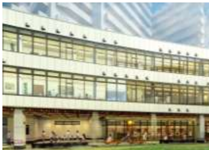
▲こども園が開園する A棟外観イメージ