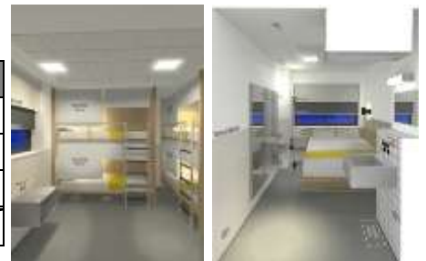
▲B棟ホテル客室イメージ (左:ドミトリー、右:ダブル)