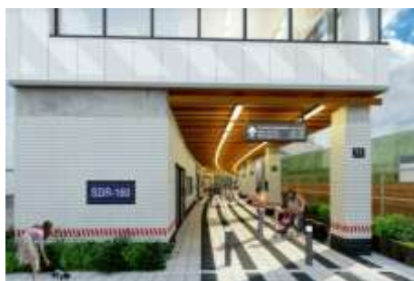
▲A棟自由通路イメージ