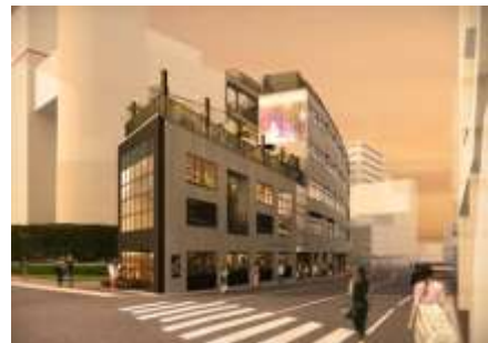
▲B棟外観イメージ (代官山駅側)