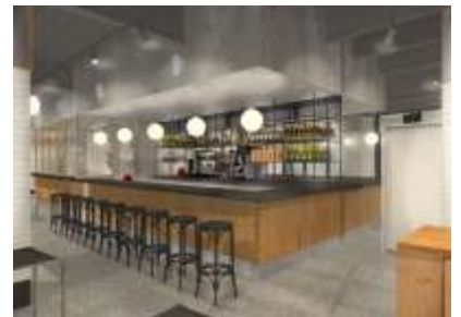
▲B棟ホテル 1階カフェ・ラウンジイメージ