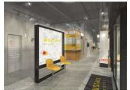
▲B棟ホテルエントランスイメージ