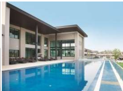
▲スイミングプール