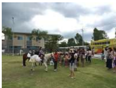
敷地内公園での乗馬体験