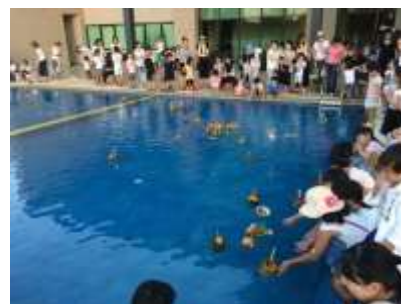
タイの伝統行事ロイクラトン