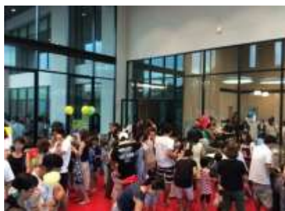
ハーモニック秋祭りの様子