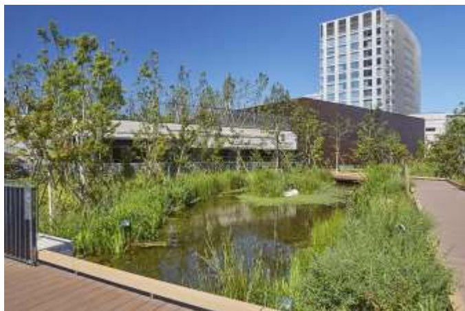
多摩川の生態系を学べるビオトープ「めだかの池」

※LEED(Leadership in Energy and Environmental Design) 米国グリーンビルディング協会が所管する環境性能評価指標。エネルギー効率に優れ、持続可能な建築物を普及することを目的に、世界150か国以上で取り入れられています。