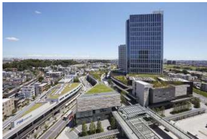
地域の生態系をつなぐ約6,000㎡のルーフガーデンを整備したほか、最新の環境配慮建築の手法に基づきグリーンビルディングへ取り組んでいる