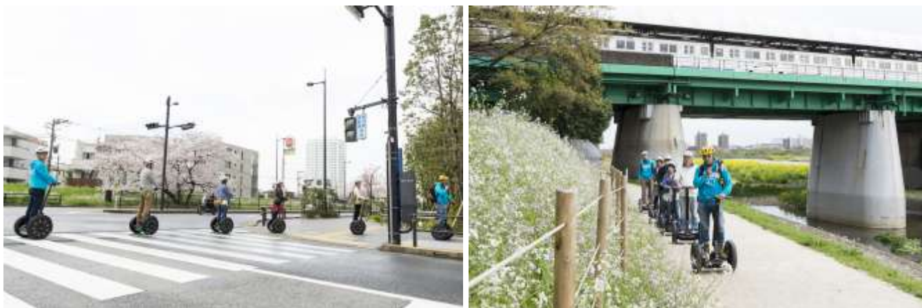
「セグウェイツアーin 二子玉川」の様子

2020年の東京オリンピック・パラリンピック開催も視野に入れ、本取り組みをはじめとする、新しいテクノロジーや規制緩和などの手法を活用した実例を構築・発信し、次世代に向けたまちづくり活動を進めていきます。