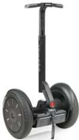
Segway PT i2 SE 基本モデル