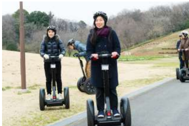
「セグウェイランチ」の活動の様子