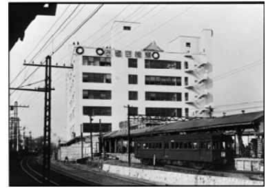
1934年当時の東横線渋谷駅と東横百貨店(現・東急百貨店)

http://www.tokyu.co.jp/railway/railway/west/gaiyou/joukou.html#toyoko