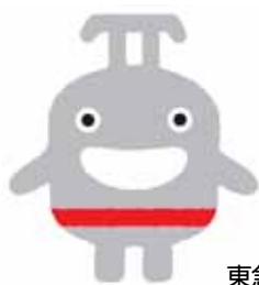
東横線のマスコットキャラクター

2013年3月16日の相互直通運転開始に向けたカウントダウンモニュメントを、東横線渋谷駅の正面口改札内に設置。8月28日(火)午後からご覧いただけます。このモニュメントのモチーフには、東横線により親しんでいただくために誕生したマスコットキャラクターを起用しました。