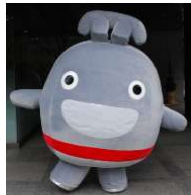
東急線キャラクター「のるるん」