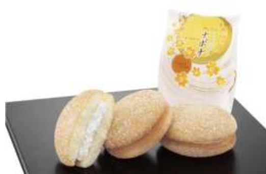
亀屋万年堂「ナボナ」