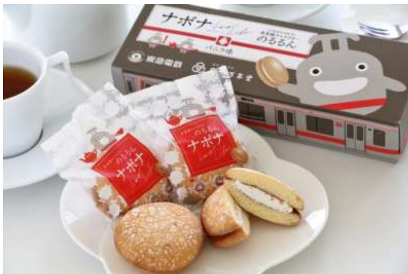
のるるんナボナイメージ