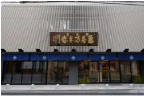
亀屋万年堂総本店(自由が丘)

亀屋万年堂は1938年に東京・自由が丘の地で創業以来、たくさんの方に「お菓子」をお届けして参りました。当時プロ野球選手の王貞治氏をテレビCMで起用し、「お菓子のホームラン王」のキャッチコピーで親しまれた「ナボナ」は、当時のテレビCMをリアルタイムでご覧いただいた世代の方々をはじめ、そのお子さまの世代・お孫さまの世代と、老若男女問わず愛され続けています。