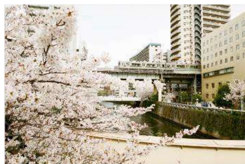
▲目黒川を渡る池上線